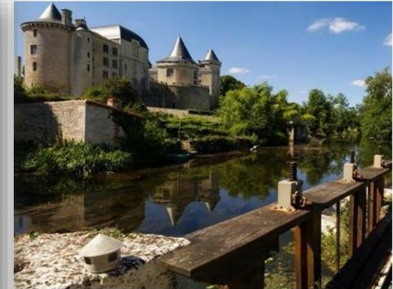
Barrage de Verteuil

El Fondo Europeo de Desarrollo Regional (FEDER) aportó 38 millones de euros para la ampliación de la planta de depuración de aguas residuales de Burgos. Las nuevas instalaciones permiten tratar los afluentes tres veces más eficientemente que las anteriores, reduciendo considerablemente la contaminación. Esta ampliación ha supuesto un gran avance en el medio ambiente de los burgaleses.