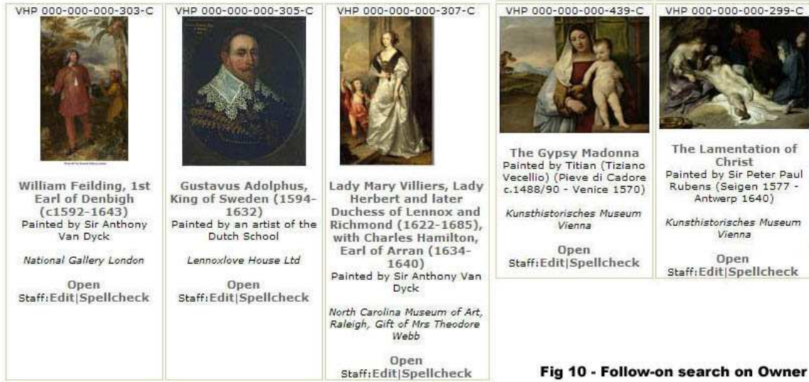
Fig 10 - Follow-on search on Owner

والنقر على "ماركيز وجيمس 1 3 دوق هاميلتون (مالك)" عرض الصور المصغرة من 5 لوحات أخرى من مجموعته (الشكل 10).