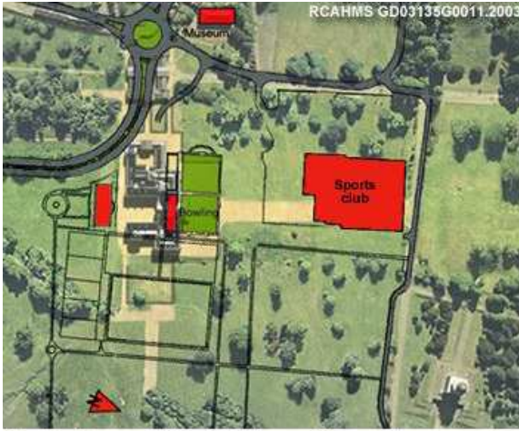
Fig 5: Zoomed Aerial View with modern overlay

التي تتيح للمستخدم الفرصة لتكبير و رؤية أدق التفاصيل ، وتواكب معهم الخطوط العريضة لأعمال البناء التي وقعت على موقع هدم القصر منذ 90 عام (الشكل 5).