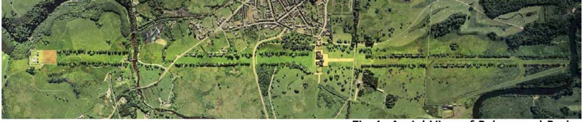
Fig 4: Aerial View of Palace and Parks

ومن الممكن أيضا لإنشاء عرض تخيلي من الجو لحدائق القصر كما كانت موجودة في نهاية القرن التاسع عشر (الشكل 4) ،