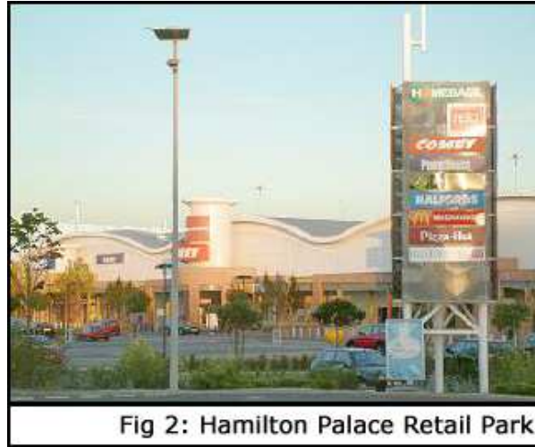
Fig 2: Hamilton Palace Retail Park

إن المقتنيات الفنية لألكسندر في قصر هاميلتون ستتضاءل مثل مجموعة بيريل الشهيرة. للأسف ، وتشتت الآن على اتجاهات أربع معروضة في مزاد علني لسداد ديون الأسرة. ولكن ما هو أكثر مأساوية هو المصير الذي أصاب المبنى الذي كان يضم مجموعته الرائعة.. من الصعب بالنسبة لنا اليوم أن نعتقد أن بمصير هذا المبنى الضخم بالرغم من أن عائلة هميلتون كانت تشارك بشكل كبير في صناعة التعدين. و لكن للأسف لم تعر أهتماما بأسس قصرها الذي قوض أنه قوض في وقت مبكر من تسع مئة عام و قد دمر تماما بحلول عام 1921 ، أصبح اليوم هذا المنزل الكبير مركز رياضي وحديقة للبيع بالتجزئة. (الشكل 2)