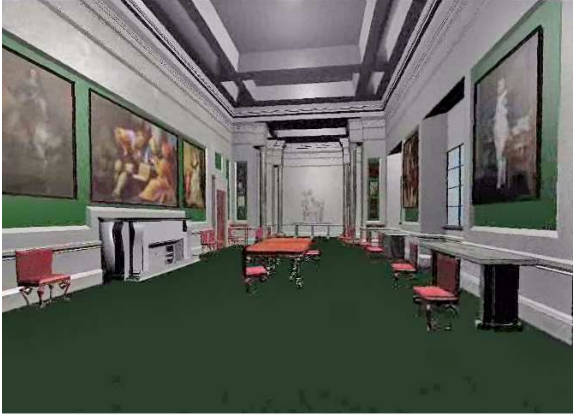
Fig 12 - Virtual New Dining Room

يقوم طلبة في قسم علوم الحاسب في جامعة جلاسكو و بإشراف من قسم الوسائط المتعددة لمتحف Hunterian ببناء غرفة الطعام الجديد بالقصر إفتراضي ثلاثيه الأبعاد و بلألوان الكاملة استنادا إلى مخطط الأدوار و صور "عنان" الفوتوغرافية وقوائم الجرد ومذكرات من وإلى البنائين والمصممين وصور من الأثاث والتجهيزات والأعمال الفنية المعروفة بتواجدها في عام 1870 الشكل (12).