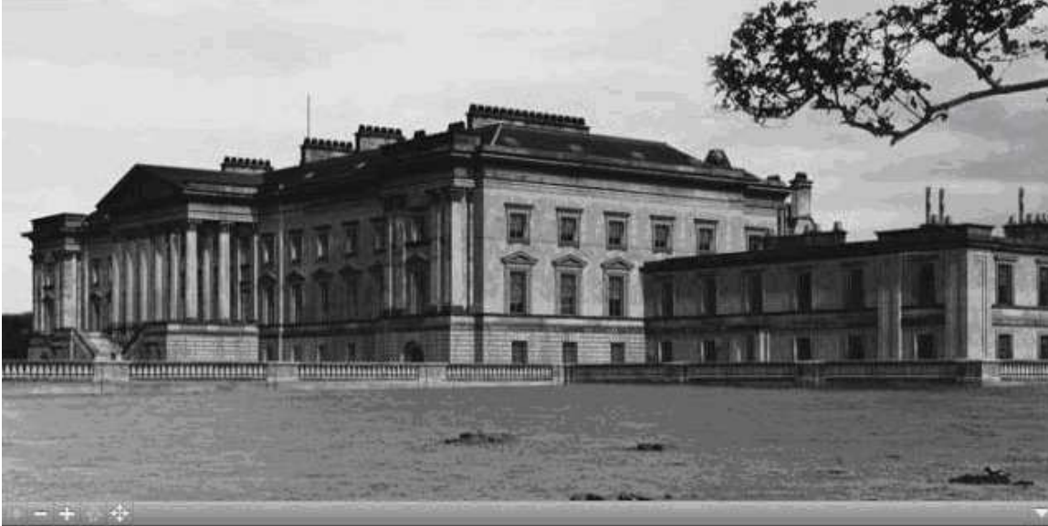
Figure 3: Virtual Reconstruction of the Palace

الشريك التكنولوجية لـ VHPT هي شبكة موارد الأتصال التكنولوجية الثقافية الاسكتلندية (SCRAN) بالتعاون مع الهيئة الملكية للمعالم التاريخية القديمة باسكتلندا (RCAHMS) ، أنتجت VHPT نموذجية لاطهار ما يمكن القيام به ، بما في ذلك نماذج بسيطة للواقع الافتراضي للقصر المفقود ، وعلى أساس الرسوم الأصلية للمهندسين (بما فيها تلك التي وليام آدم 1730) ، وخطط عام 1920 ، وصور من القرن 19. (الشكل 3).